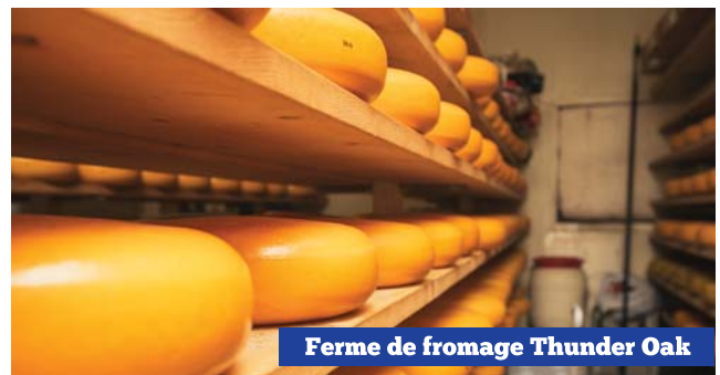
Ferme de fromage Thunder Oak