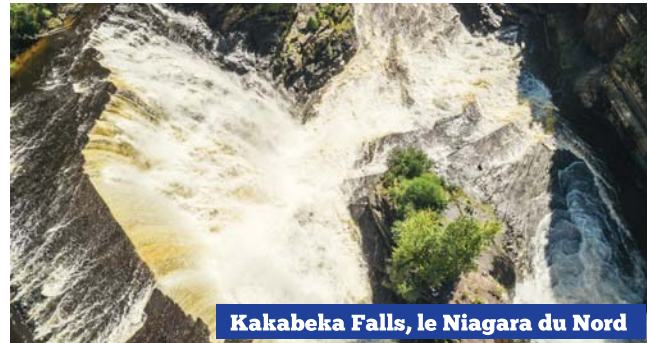
Kakabeka Falls, le Niagara du Nord