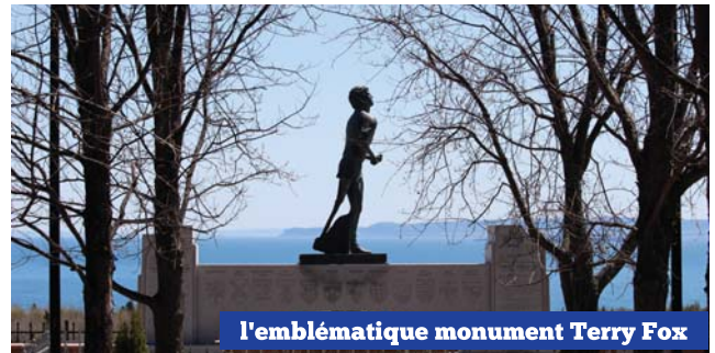
l'emblématique monument Terry Fox

Profitez de 9 trous de golf sur l'un des parcours les plus pittoresques de Thunder Bay avec un bon de 20$ pour le restaurant pour seulement 49$ par personne, taxes en sus. Réservez par téléphone au (807) 475-8925 en utilisant le code CCCAGM18.